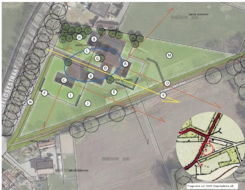
Nieuwe situatie, niet op schaal.

Voor verdere toelichting zie: Ruimtelijk kwaliteitsplan N+L Landschapontwerpers