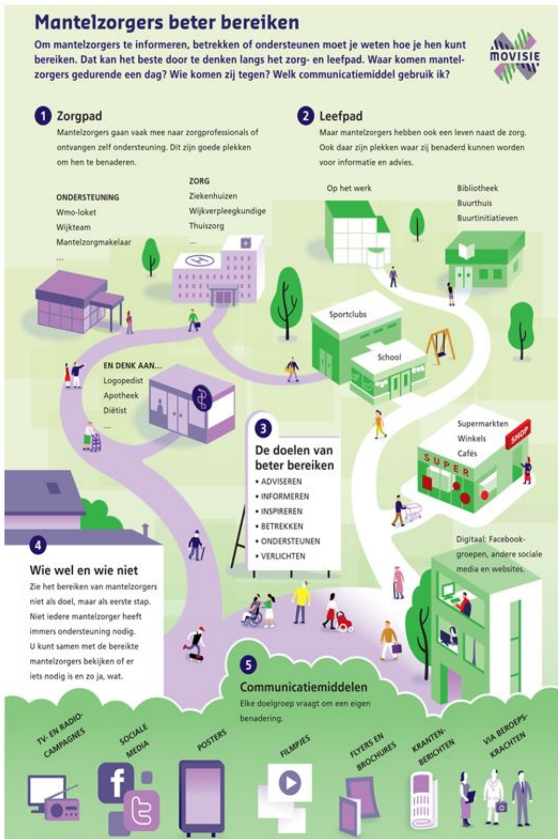
Bijlage 3: Samenvatting denktanks, gesprekken met mantelzorgers