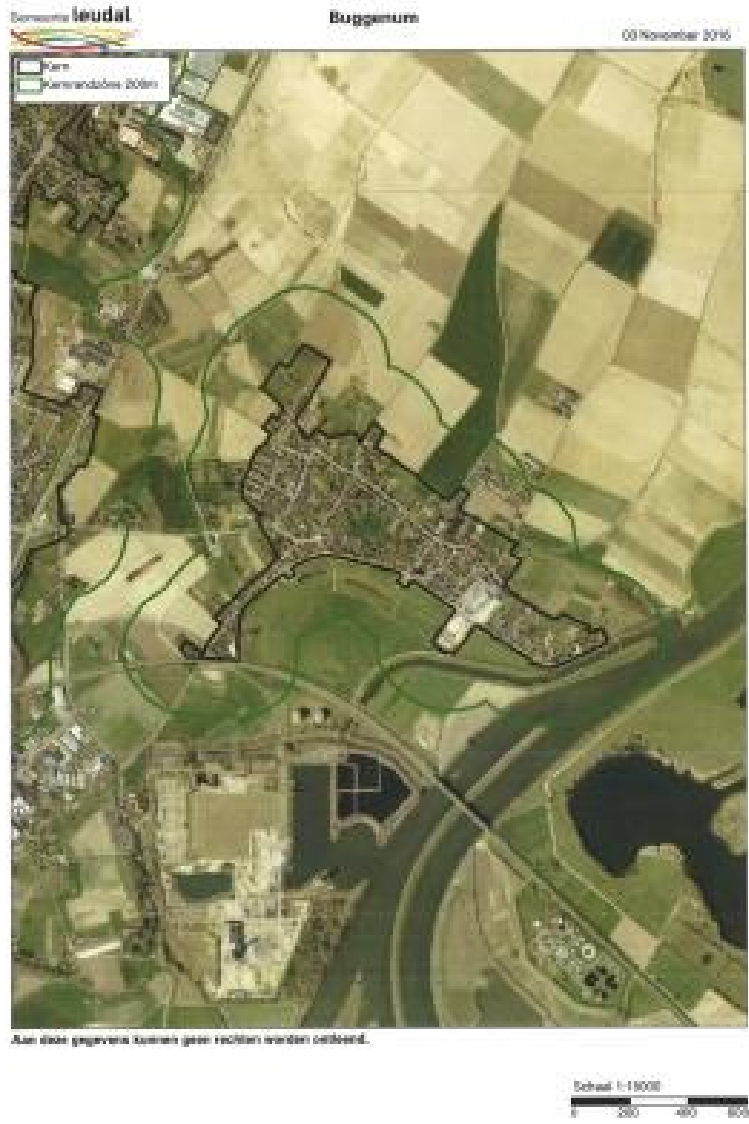
Alle steden gegevene kernen (geen rechten worden oetbeend).