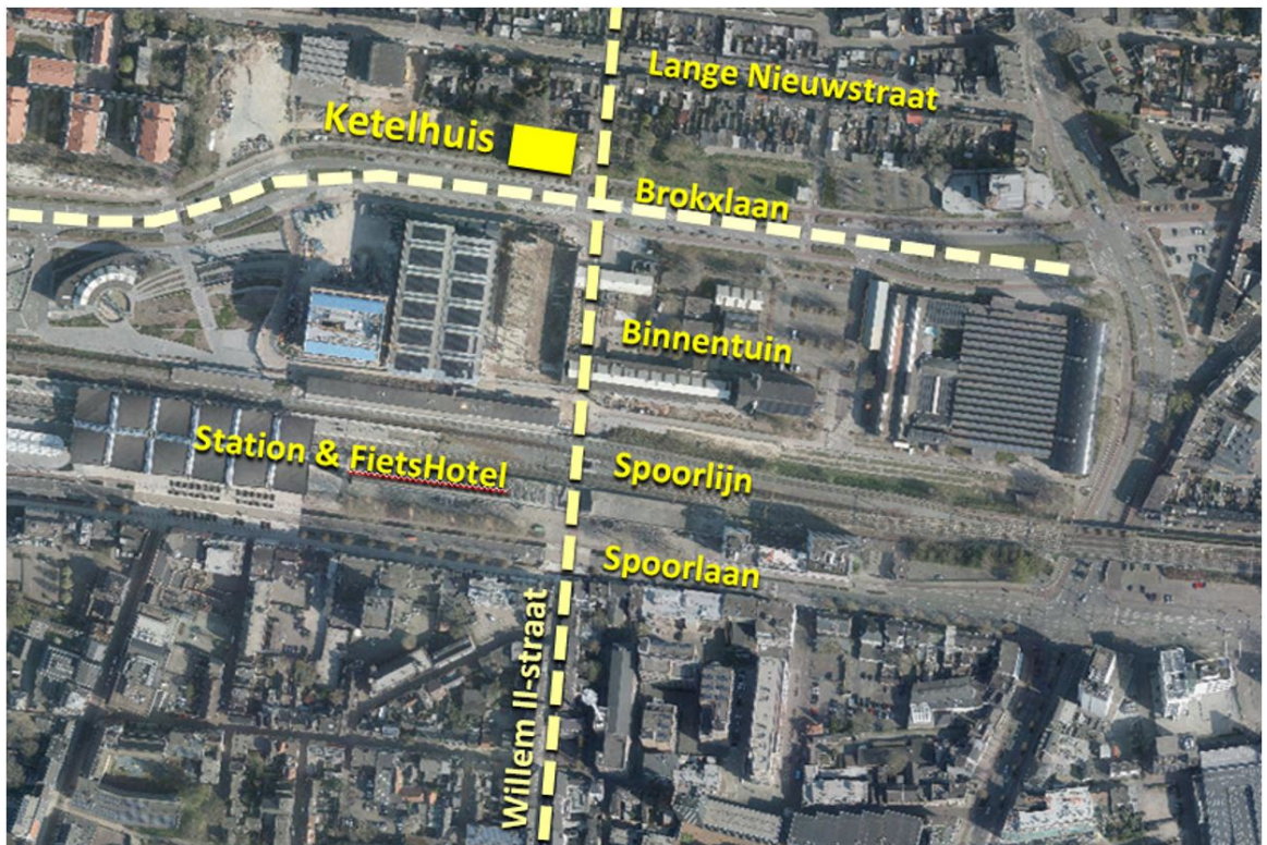
Ligging in de Spoorzone

Het Ketelhuis lag voorheen verstopt achter de hekken van de NS-werkplaats. Met de ontmanteling van de werkplaats, de aanleg van de Burgemeester Brokxlaan en de route Atelierstraat-Willem II Passage heeft het Ketelhuis een prominente positie in het stedelijke netwerk en zichtbare positie in het stadsbeeld. Met name in de relatie tussen de stadsdelen Theresia en Binnenstad en de bereikbaarheid van onder andere het Fietshotel in het hart van de werkplaats.