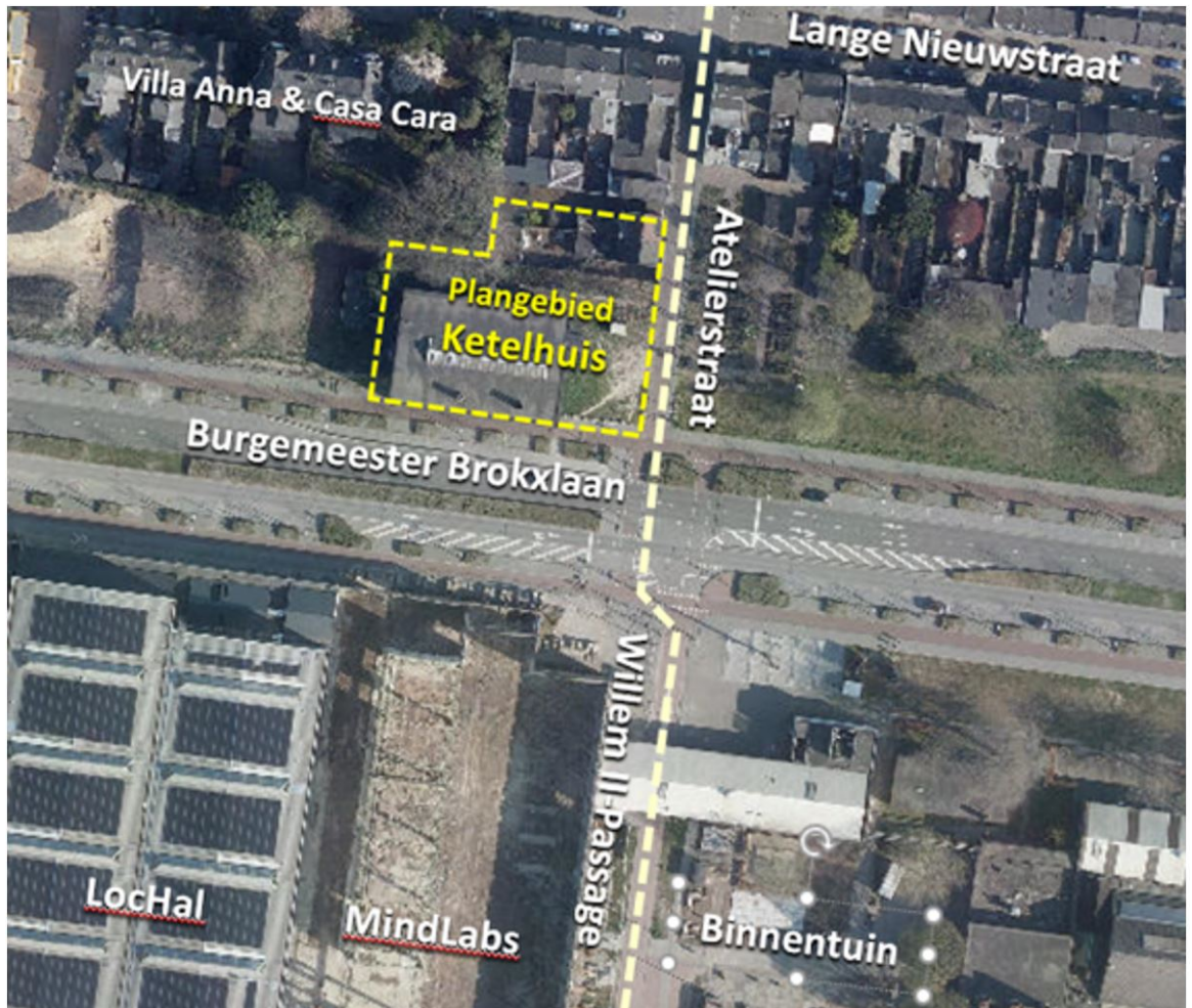
Directe omgeving en Plangebied