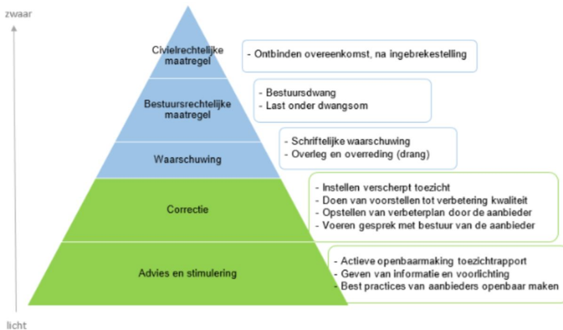
Figuur 2: Piramide handhavingsmaatregelen

Zoals hierboven is vermeld, kan de toezichthouder advies, stimulering en correctie toepassen. De gemeente kan dwang toepassen om het nalevingsgedrag van aanbieders te bevorderen, om risico's te verminderen en de kwaliteit van ondersteuning te verbeteren. De toezichthouder en de gemeente hanteren de volgende piramide (zie figuur 2) naar zwaarte van de maatregel, bij het inzetten van interventies.