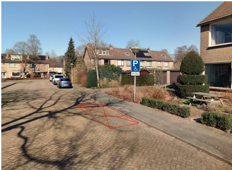
Buntplein 1, Maarn