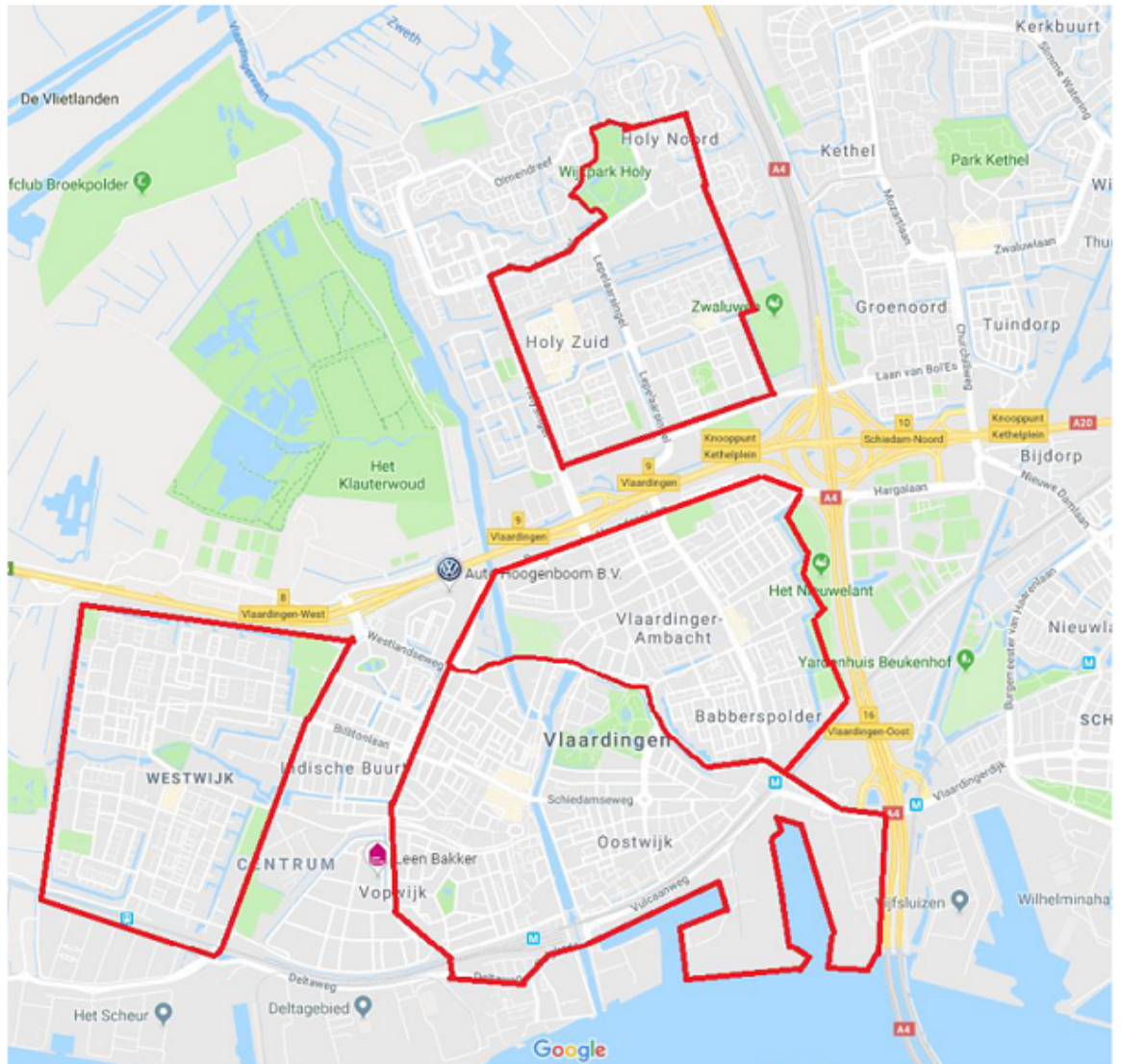
Vlaardingen-Centrum (inclusief Oostwijk)