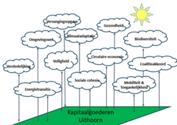
Figuur 1 Maatschappelijke thema's uit het IBOR waaraan de openbare ruimte bijdraagt

De openbare ruimte levert een belangrijke bijdrage aan de doelen van de gemeente. De gemeente heeft daarnaast de plicht om de openbare ruimte deugdelijk te beheren. Voor het beheer van de openbare ruimte gelden eisen en richtlijnen. Daarnaast heeft de gemeente zelf een strategie voor de openbare ruimte geformuleerd: het IBOR. In figuur 1 zijn maatschappelijke thema's weergegeven waaraan de openbare ruimte bijdraagt.