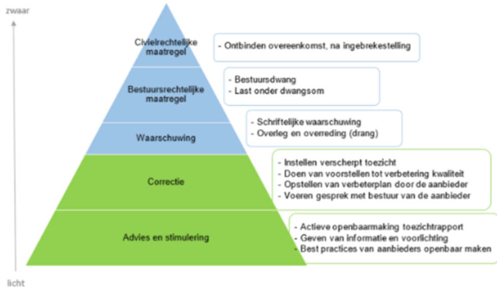
Figuur 2: Piramide handhavingsmaatregelen

Zoals hierboven is vermeld, kan de toezichthouder advies, stimulering en correctie toepassen. De gemeente kan dwang toepassen om het nalevingsgedrag van aanbieders te bevorderen, om risico's te verminderen en de kwaliteit van ondersteuning te verbeteren. De toezichthouder en de gemeente hanteren de volgende piramide (zie figuur 2) naar zwaarte van de maatregel, bij het inzetten van interventies.