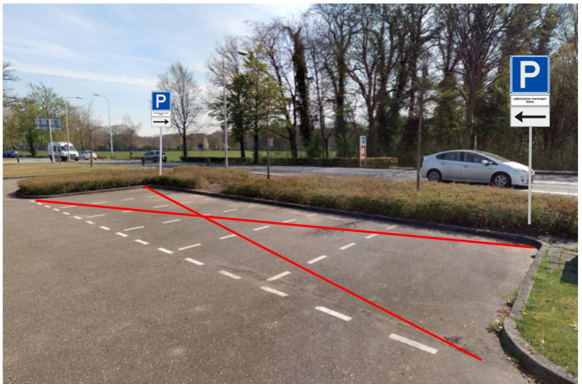
Hengelo, Gemeente Bronckhorst