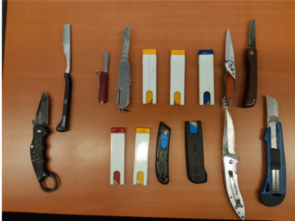
Inhoud dropbox horecagelegenheid, mei 2019

Een vorige leging, in januari 2019, leverde onderstaande op: