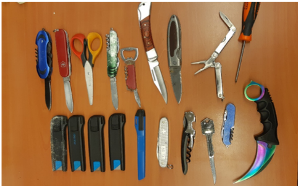
Inhoud dropbox horecagelegenheid, januari 2019

Een vorige leging, in januari 2019, leverde onderstaande op: