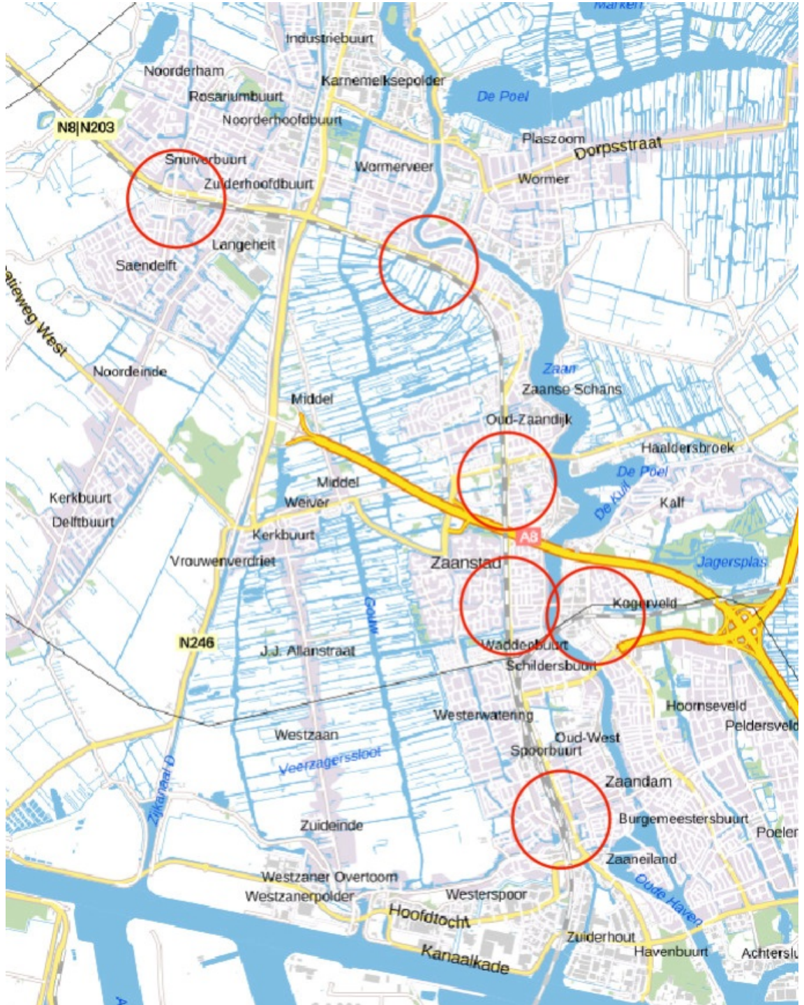
Bijlage 2 Kaartjes centrumgebieden