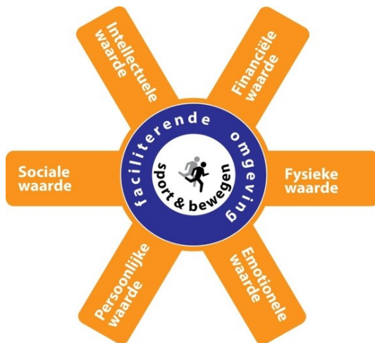
De effecten van sporten en bewegen