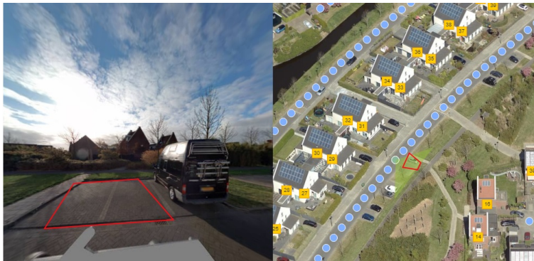
hemelboog binnen thv 31