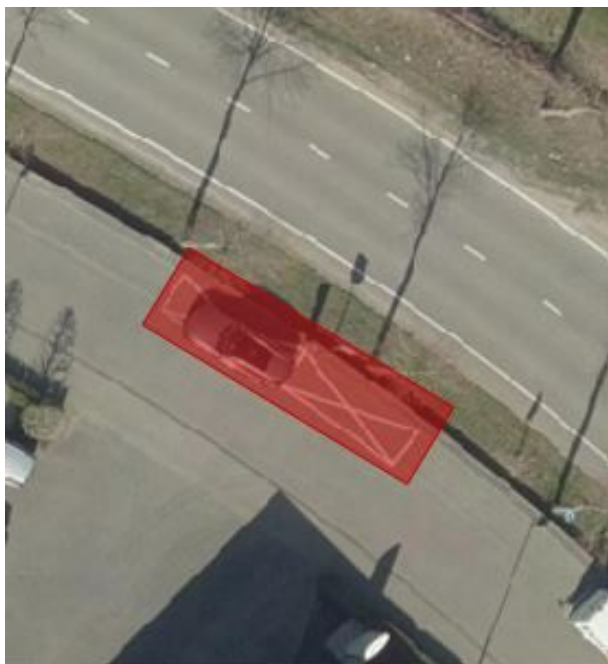
3. Reserveren 2 parkeerplaatsen ter hoogte van Gommersstraat 79 te Rijsbergen