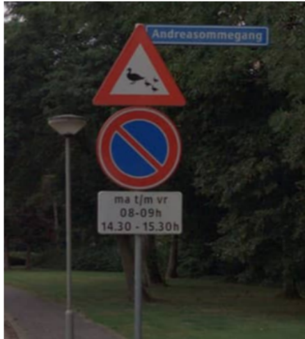
RVV E01 met onderbord "maandag tot en met vrijdag tussen 8-9h en 14.30-15.30h" (zie foto's)