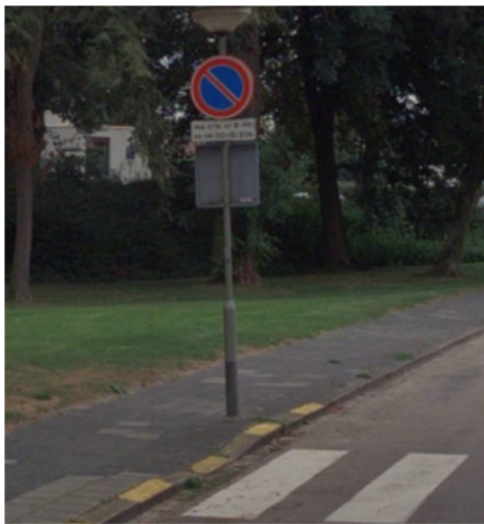
Einde K&R ter hoogte van zebra Vijverweg