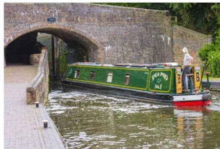
Als het maar anders is, duikboot of narrowboat als bijzondere verblijfsaccommodatie