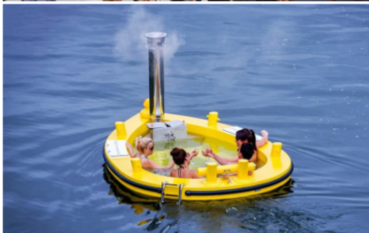
Bijzondere functies, zwemmen of wellness