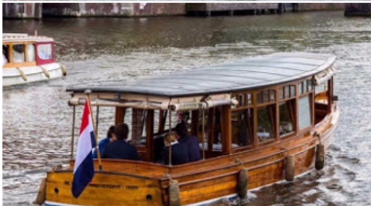
Bijzondere schepen, stoomboot, notarisboot of anderszins