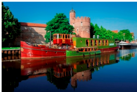
Kunst aan boord, beeldend, tijdelijk, of permanent met een 'verhalenboot'