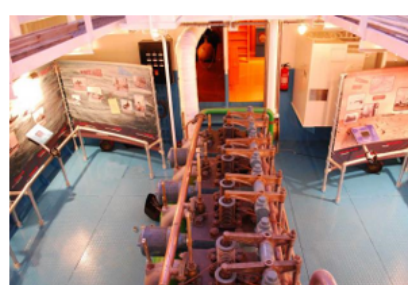
Leuke publieke functies, kookworkshops, museum aan boord