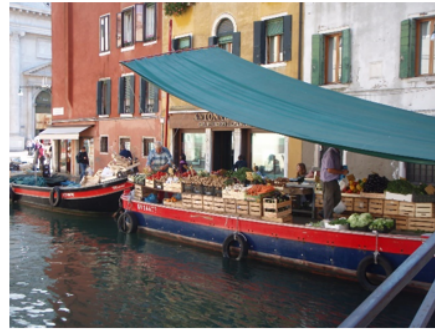
Levendigheid op het water, spelen of kopen