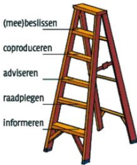
Figuur 3 Participatieladder

aan, van informeren tot (mee)beslissen. Een niveau hoger of lager zegt niets over beter of slechter. In verschillende ontwikkelings- en procesfases kan er per actor en per vraag- of doelstelling een passend niveau van participatie gekozen worden. Belangrijk is een heldere communicatie over het gekozen niveau.