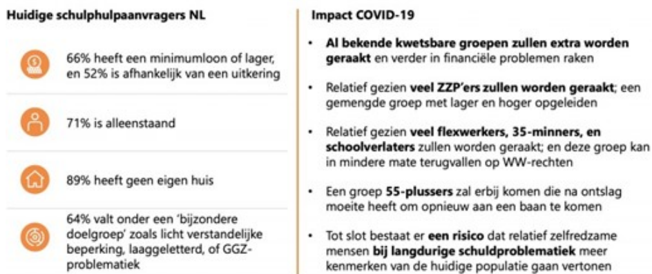
Afbeelding 1: illustreert de gevolgen van de corona-crisis zoals hierboven omschreven (Deloitte, 2020):

Hoe de toekomst er precies uit gaat zien is nog niet duidelijk. Maar dat de groep mensen met financiële problemen stijgt en dat er een relatief nieuwe groep mensen ontstaat die tijdige en passende ondersteuning nodig heeft is een feit. Het is voor ons zaak om deze groep mensen in een zo vroeg mogelijk stadium te bereiken en passend te ondersteunen om grotere problemen in de toekomst te voorkomen.