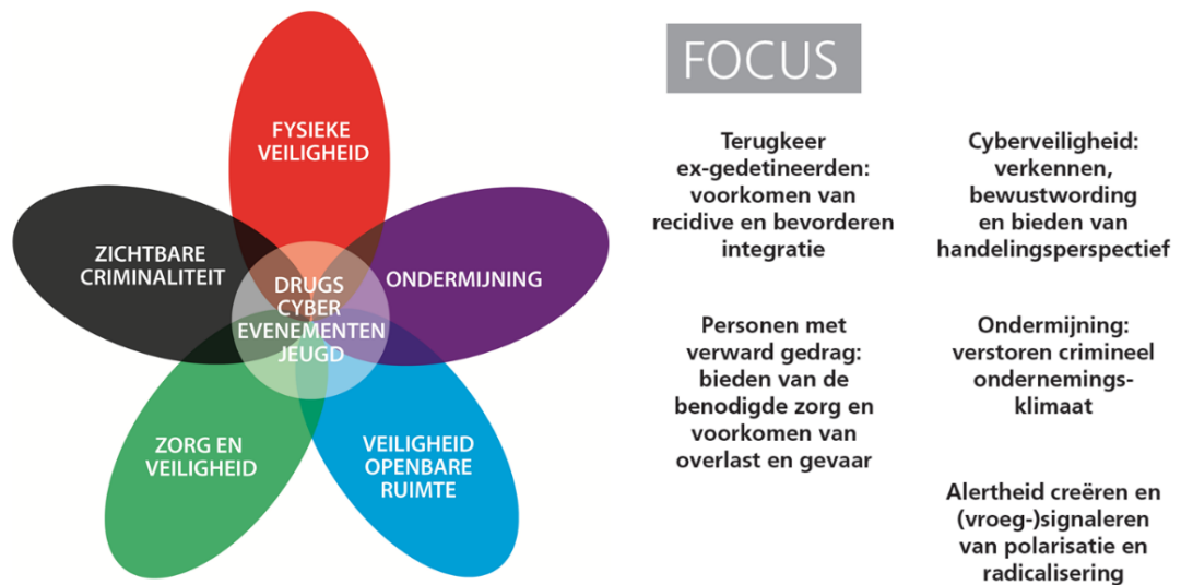
Afbeelding 1: Hoofdthema's en focuspunten van het meerjarenprogramma

De doelstellingen en focuspunten van het meerjarenprogramma liggen niet voor vier jaar vast. We kunnen de keuzes aanscherpen en eventueel herzien via een cyclus van evaluatie en monitoring, en door informatiegestuurd te werken. Eventuele wijzigingen werken dan door in onze uitvoeringsprogramma's.