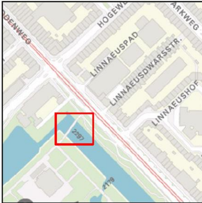
Maria Sibylla Merianbrug, brugnummer 2297