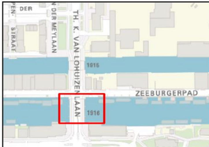
Johan Rädeckerbrug, brugnummer 1916