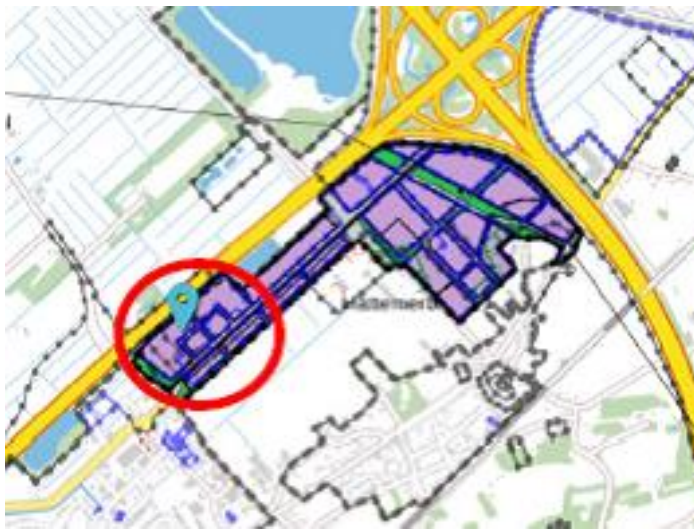
Figuur 3: Zoekzone zelfstandige kantoren op het bedrijvenpark H2O

Gelet op het vorenstaande gelden voor het bedrijvenpark H2O bij de beoordeling van aanvragen om een omgevingsvergunning voor de realisatie van kantoren de volgende beleidsregels: