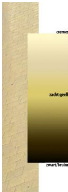
Kleurstelling voor terrasmeubilair binnenstad

Al het meubilair in de binnenstad moet passen binnen de voorgeschreven kleurstelling. De keuze hiervoor is gebaseerd op stedenbouwkundig beeld van de stad met haar gele steen. Verder is gekozen voor de natuurlijke kleuren van hout en rotan. De kleurschakering loopt van crème-wit naar zacht geel, naar donkergrijs, donkerbruin en zwart. Binnen deze kleurstelling zoekt de horecaondernemer de stijl die bij zijn onderneming past.