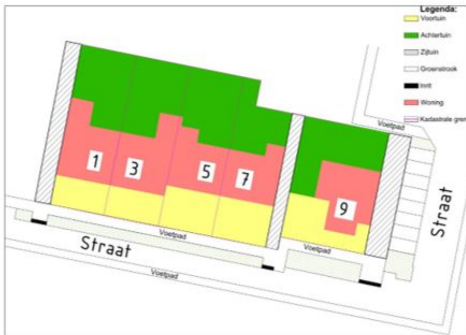
Figuur 1: afbeelding ter verduidelijking definities voortuin en zijtuin