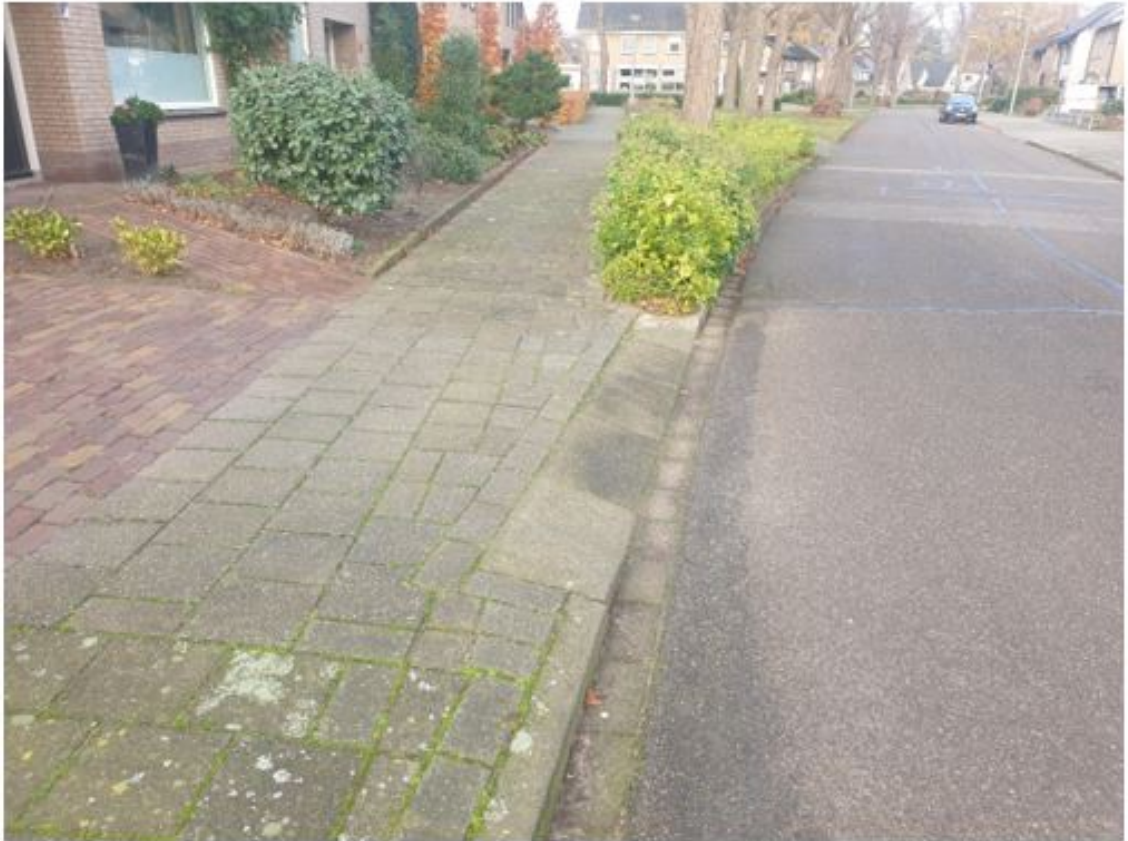
Figuur 4: Voorbeeld van een niet-openbare uitweg