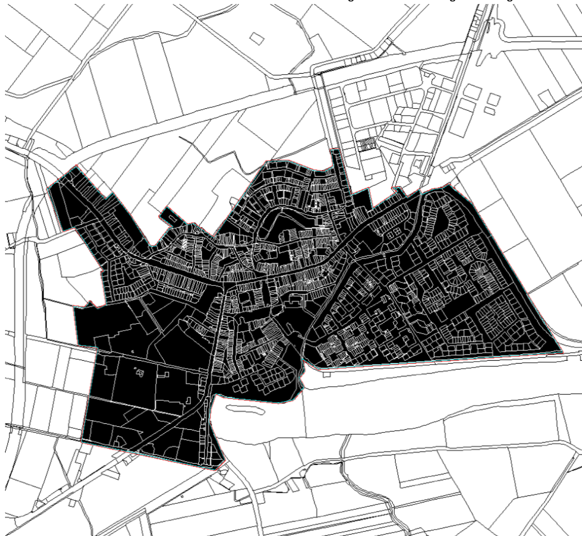
Reclamebelasting Oostburg, kaart deelgebied 1 (Kern)

Overzichtskaarten als bedoeld in artikel 2 van de Verordening reclamebelasting Oostburg 2021