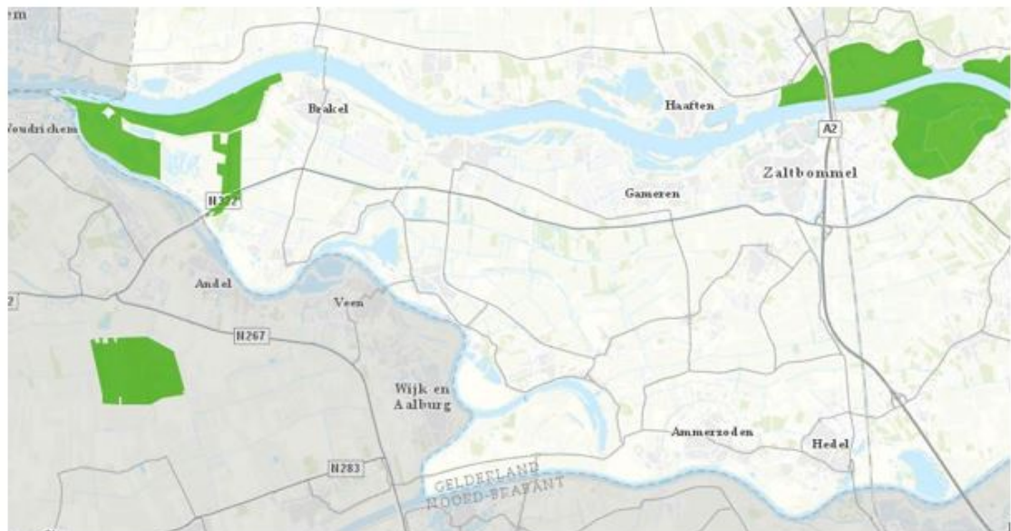
Afbeelding 2: Natura 2000 gebieden gemeente Zaltbommel

De provincie Gelderland kent een aantal Natura 2000 gebieden. In deze gebieden is de procedure zoals in deze nota beschreven niet van toepassing. Het organiseren van een evenement in een Natura 2000 gebied kan alleen worden aangevraagd via de Omgevingsdienst Rivierenland. Voor de gemeente Zaltbommel zijn hieronder de Natura 2000 gebieden weergegeven: