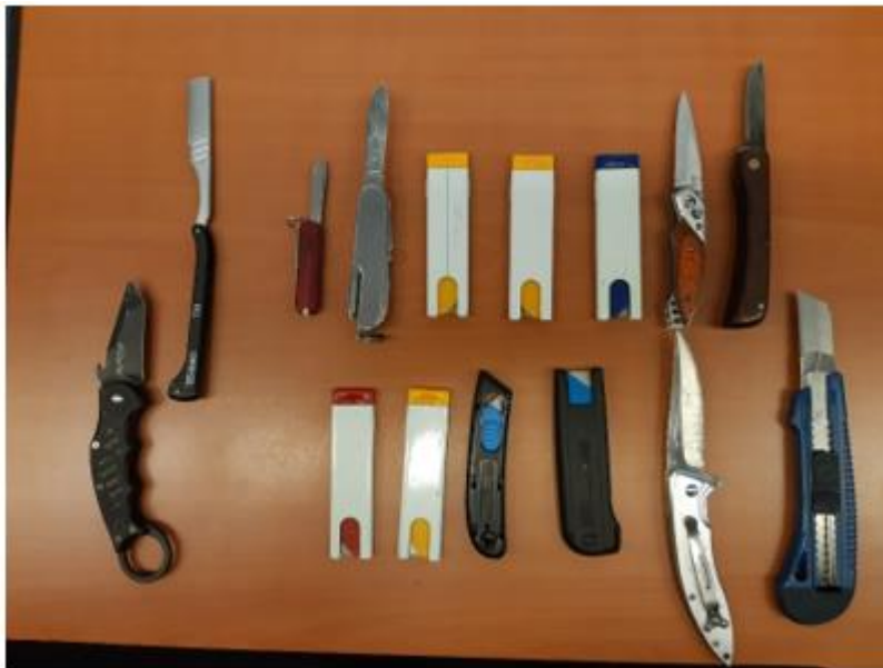
Inhoud dropbox horecagelegenheid, mei 2019

Een vorige leging, in januari 2019, leverde onderstaande op: