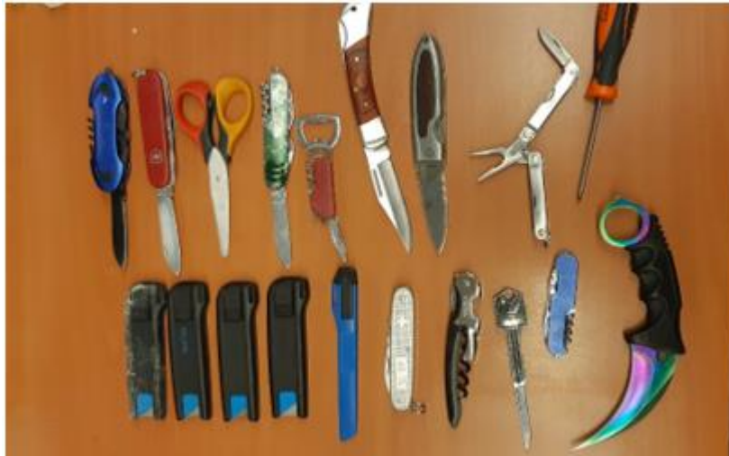
Inhoud dropbox horecagelegenheid, januari 2019

De resultaten van de maanden januari en mei 2019 geven een duidelijk beeld over het bij zich hebben van (steek)wapens waarvan het niet gebruikelijk is of zou moeten zijn die bij je te dragen tijdens een uitgaansavond. Ook dat is te typeren als een zorgelijke ontwikkeling.