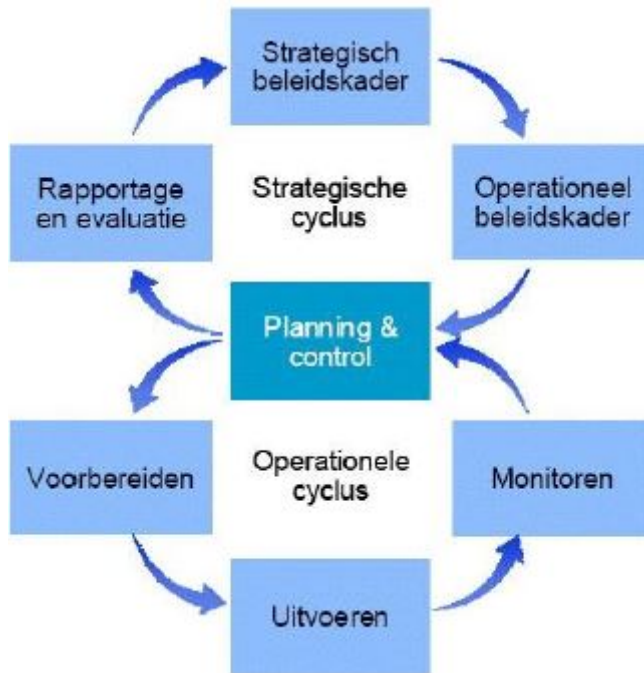
Figuur 1: Beleid- en uitvoeringscyclus

Het plan maakt onderdeel uit van de beleidscyclus zoals wettelijk vastgelegd in het Besluit omgevingsrecht (Bor) en legt een relatie met landelijke kwaliteitscriteria die zijn opgesteld voor de uitvoering van de VTH- taken. In het Bor staan minimumeisen waaraan elke professionele VTH-organisatie moet voldoen. Deze eisen hebben tot doel de uitvoering van de VTH-taken op een adequate, herkenbare en structurele wijze te laten verlopen. Hierbij wordt gebruik gemaakt van een procesmodel waarmee een logische aaneenschakeling tot stand wordt gebracht van diverse bestuurlijke en uitvoerende werkprocessen. Dit procesmodel is, naar zijn vorm, bekend geworden onder de benaming 'Big 8'.