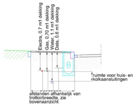
Doorsnede schaal 1:50