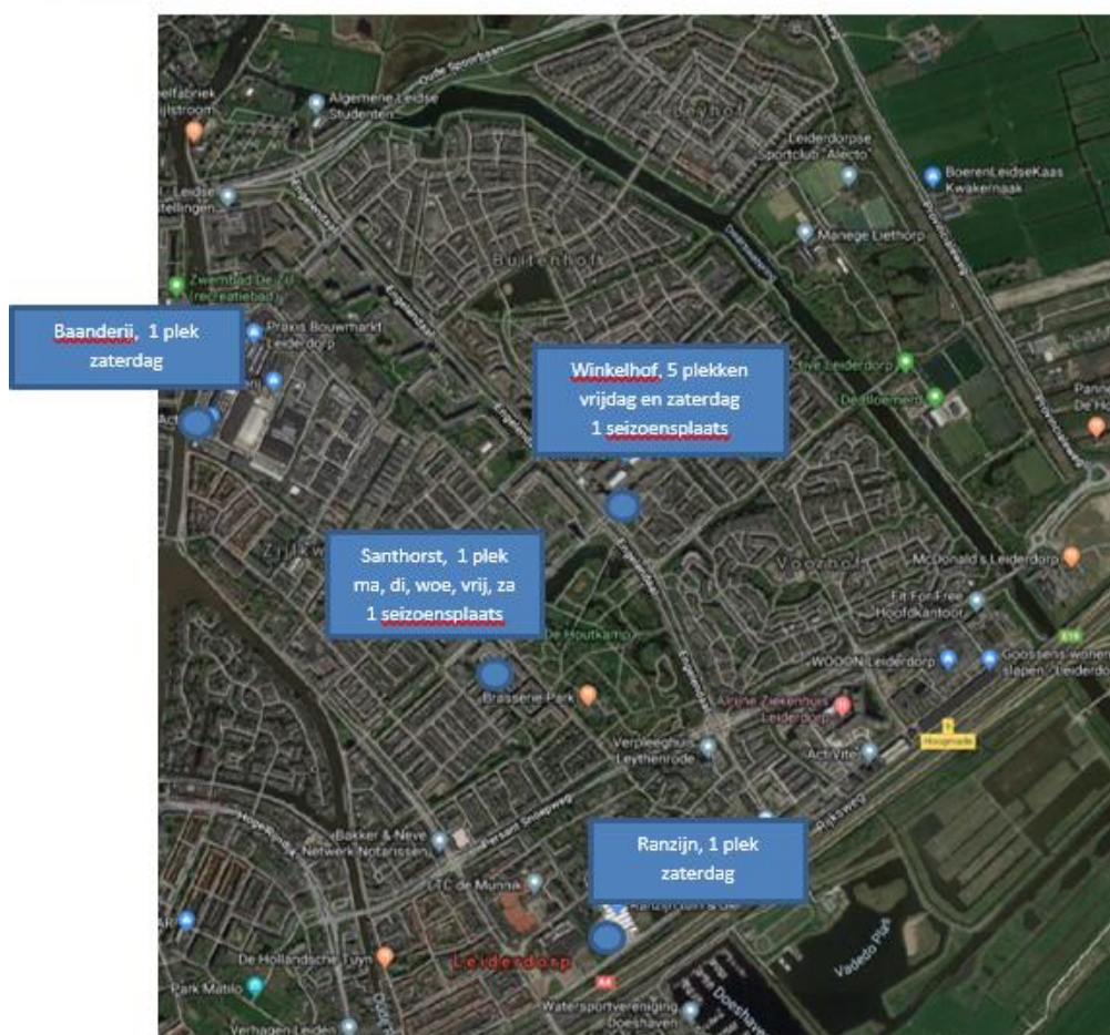
Figuur 2. Standplaatsen in Leiderdorp

hebben. Dit geldt uiteraard niet voor standplaatshouders die op particulier terrein een standplaats hebben).