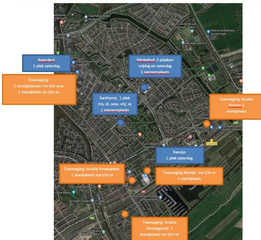
Figuur 3. Mogelijke extra standplaatslocaties en uitbreiding extra dagen

Met deze uitbreiding wordt een evenwichtiger aanbod en spreiding van standplaatsen nabij winkelgebieden en -locaties in Leiderdorp beoogd. Op onderstaande plattegrond wordt dit ruimtelijk gevisualiseerd.