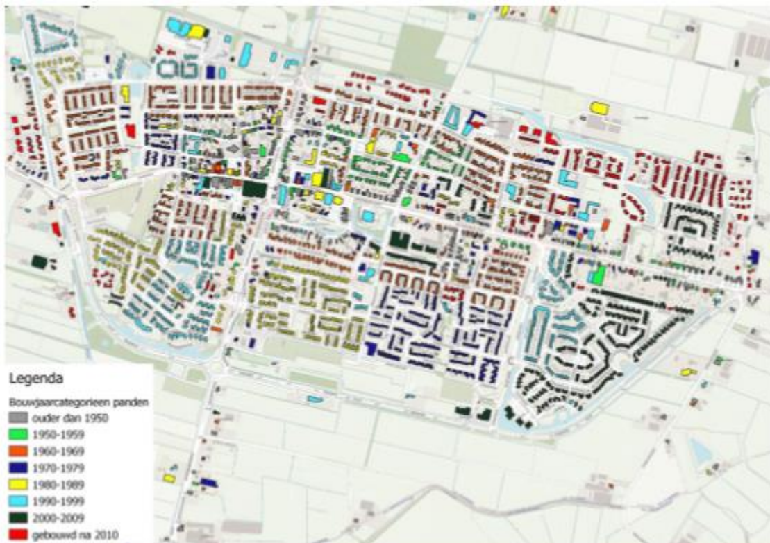
Figuur: Bouwjaarcategorieën panden

In het buitengebied is het agrarisch gebruik van groot belang. Dit geeft in combinatie met de cultuurhistorie en de natuur- en landschapswaarden het buitengebied een veelzijdig karakter met een recreatieve aantrekkingskracht. Het recreatiegebied Henschotermeer, een voormalige zandafgraving, is in de regio zeer geliefd. Net als de Pyramide van Austerlitz, een 17 meter hoge piramide van aarde, gebouwd in 1804 door napoleontische soldaten, een van de hoogste punten van de Utrechtse Heuvelrug. In de gemeente Woudenberg komen de Utrechtse Heuvelrug en de Gelderse Vallei samen. De bebouwing ligt verspreid in het gebied. Naast de agrarische bebouwing staan in het buitengebied ook diverse woningen.