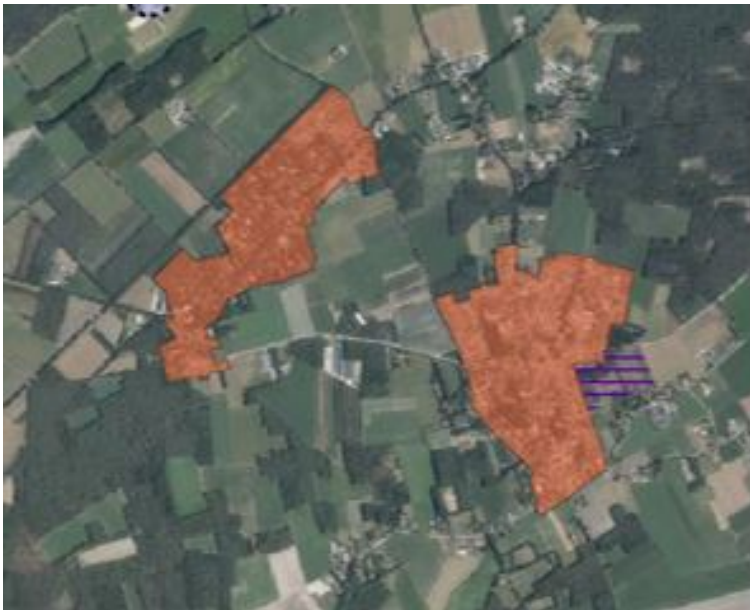
Figuur 2 kern Riethoven