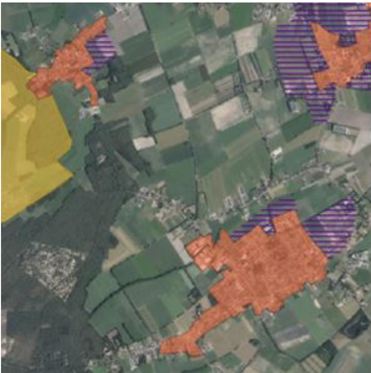
Figuur 4 kernen de Weebosch en Luyksgestel