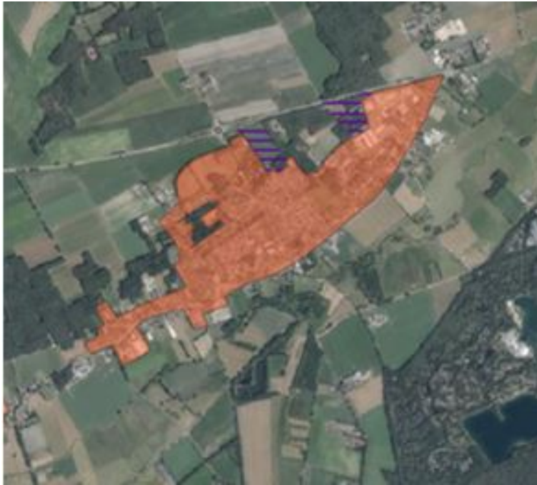
Figuur 3 kern Westerhoven