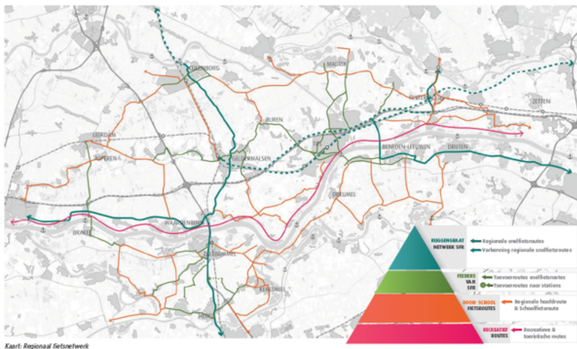
Afbeelding 1 Regionale fietsplan Rivierenland

Regio Rivierenland heeft een regionale uitwerking gemaakt van het provinciale definitiekader Hoofd-fietsnet. De regio beschouwt in haar uitwerking een aantal routes als snelle fietsroutes waarvan het provinciale definitiekader zegt dat dit een schoolroute of overige hoofdroute is. De belangrijkste toevoeging is het recreatieve netwerk dat de provincie niet heeft opgenomen in haar netwerk. In het regionale netwerk gaat dit over de recreatieve route langs de waaldijk.