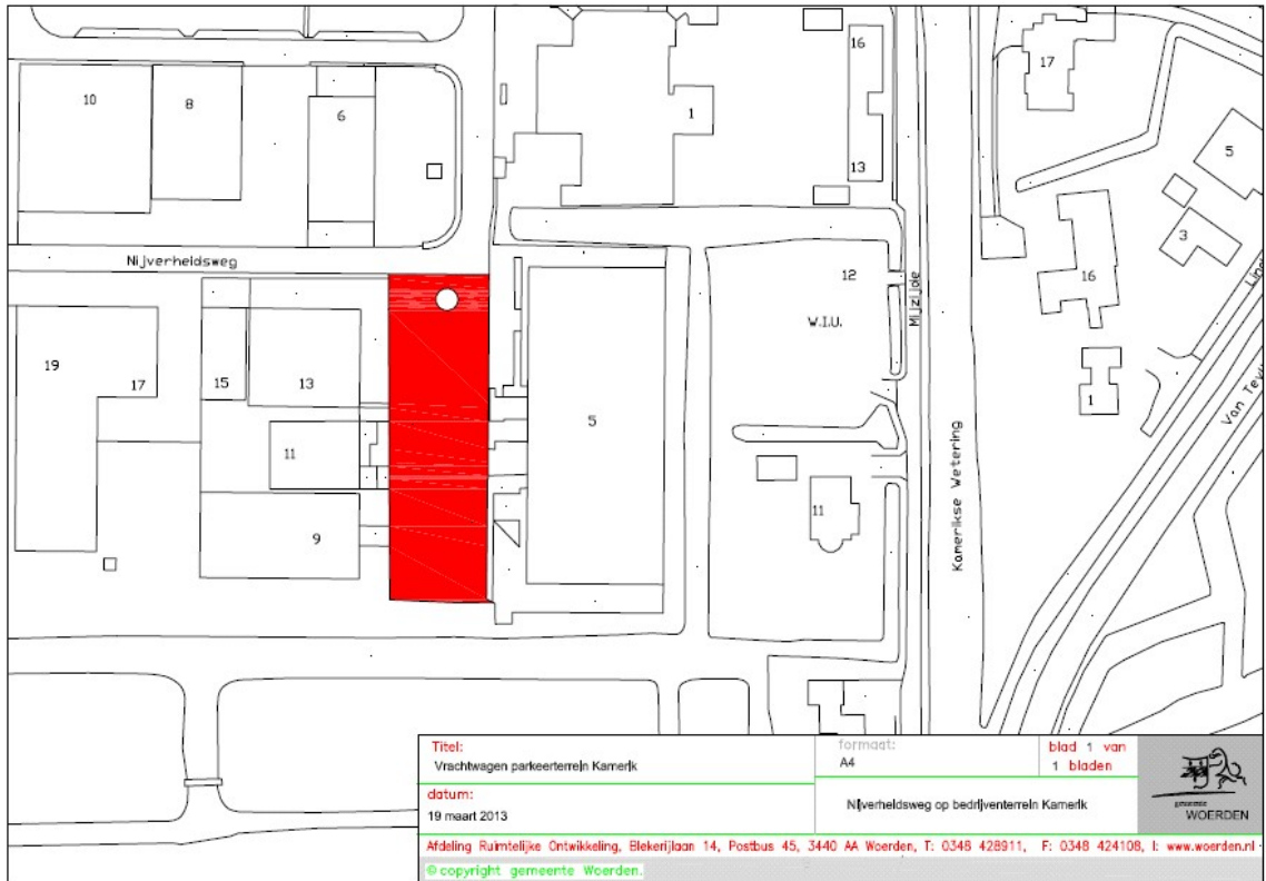
Bijlage 4 van 4, Kaart 'Vrachtwagenparkeerterrein Woerden'