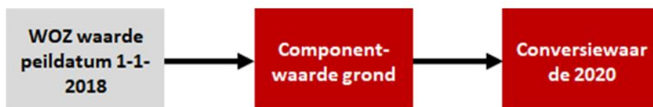
Figuur 4 Schematische weergave bepaling conversiewaarde bij tussentijdse conversie

Uitgaande van conversie in 2020 is in figuur 4 aangegeven op welke wijze de conversiewaarde wordt bepaald