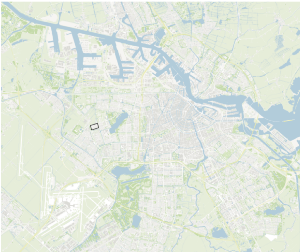
figuur 1 – overzichtskartaal van Amsterdam met het gebied 'Reimerswaalbuurt' gemarkeerd