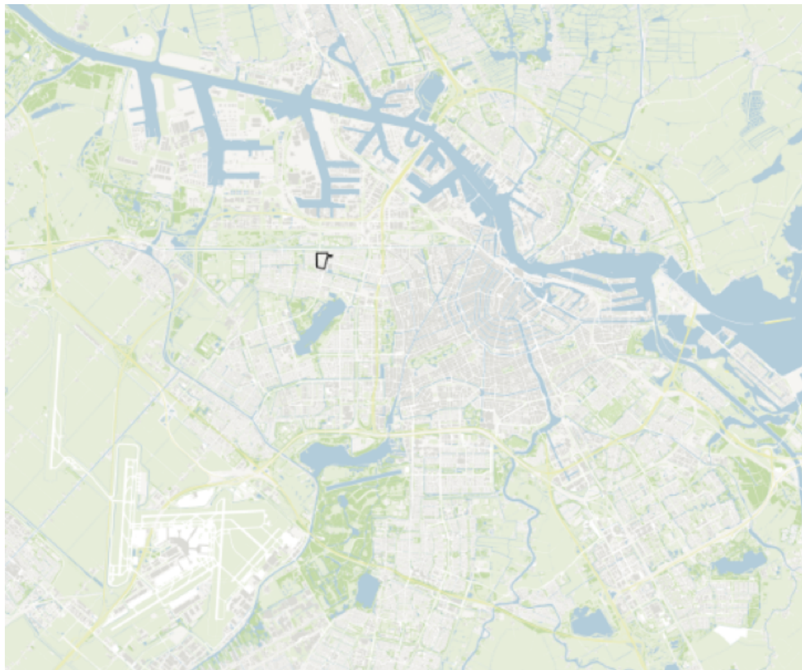
figuur 1 - overzichtkaart van Amsterdam met het gebied 'Bernard Loderbuurt' gemarkeerd