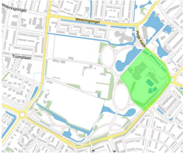
Kaart 4: Gebiedsaanwijzing evenement locaties Koningsdag en bijhorende Kermis