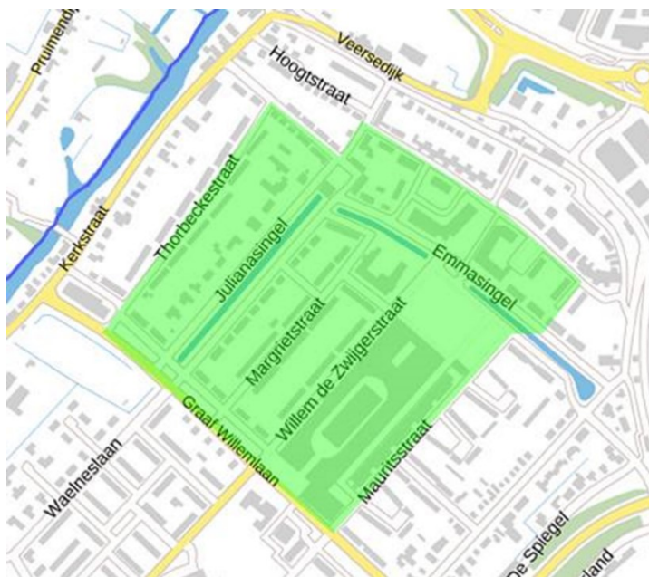
Kaart 3: Gebiedsaanwijzing evenement locaties Koningsdag en bijhorende Kermis