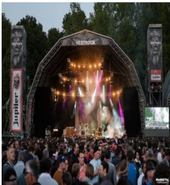
Het jaarlijkse 3-daagse Vestrock-festival