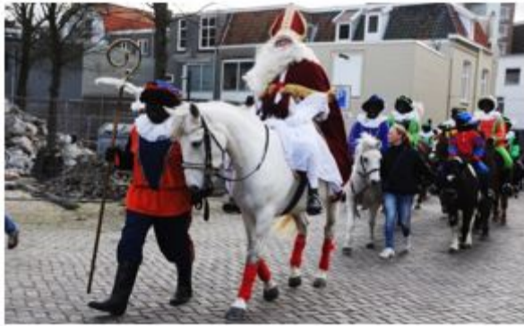
Geen vergunning nodig voor kleine evenementen

De vergunningsvrije categorie geldt onder meer voor Sinterklaasintochten, buurtbarbecues, wandel- en fietstochten, braderieën, rommelmarkten, optochten, etc.