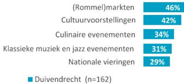
■ Duivendrecht (n=162) Figuur 1: behoefte aan evenementen in Duivendrecht