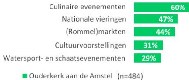
■ Ouderkerk aan de Amstel (n=484) Figuur 2: behoefte aan evenementen in Ouderkerk aan de Amstel.

In de metropoolregio Amsterdam wordt een regionaal plan opgesteld voor afstemming van evenementen, waarbij rekening wordt gehouden met een optimale verdeling van mogelijke hinder en inkomsten die bijdragen aan het beheer van gebieden. 1 Bij de vorming van dit plan, is het belangrijk dat we kunnen aansturen op hetgeen wat past bij onze lokale ambitie. Door vast te leggen welke evenementen wij in onze gemeente wenselijk achten, hebben we onze inbreng voor het op te stellen regionale plan.