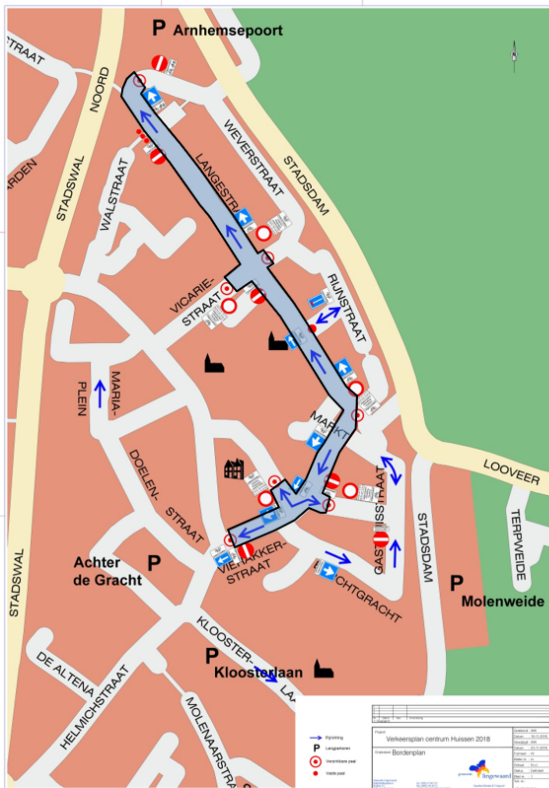
Figuur 2: Toegangswegen tot de geslotenverklaring in het centrum van Huissen.