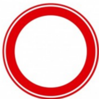
Figuur 1: Gesloten in beide richtingen voor voertuigen, ruiters en geleiders van rij- of trekdieren of vee, verkeersbord C01.

De boete voor het inrijden van de geslotenverklaring (figuur 1) zonder geldige ontheffing is € 95,- (exclusief € 9,- administratiekosten).