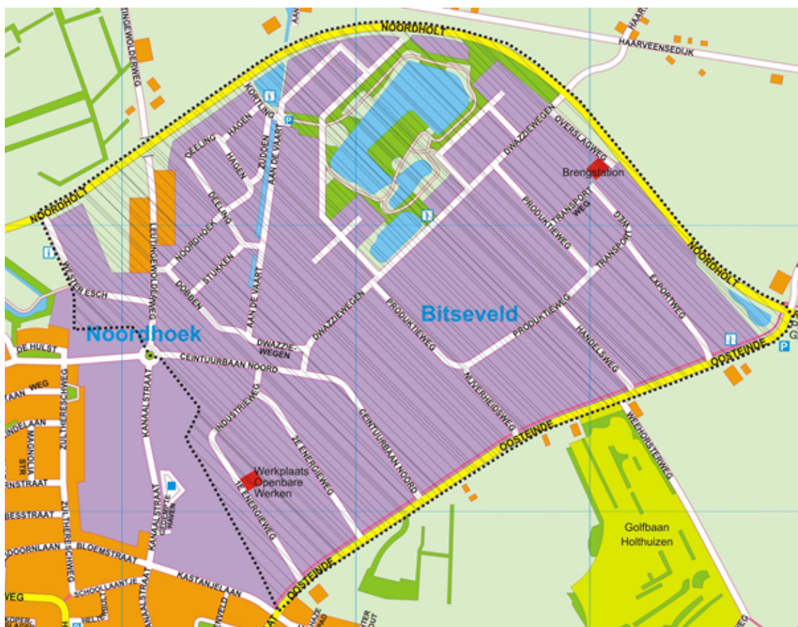
Bijlage 3: Kaart van de bedrijveninvesterings zone 'Bedrijventerrein Peize' als bedoeld in artikel 1, onderdeel a, van deze verordening.

Het gebied Bedrijventerrein Peize wordt omsloten door de onderstaande straten. Alle objecten gelegen aan en binnen de op de kaart aangegeven stippellijn vallen binnen de bedrijveninvesteringszone 'Bedrijventerrein Peize':