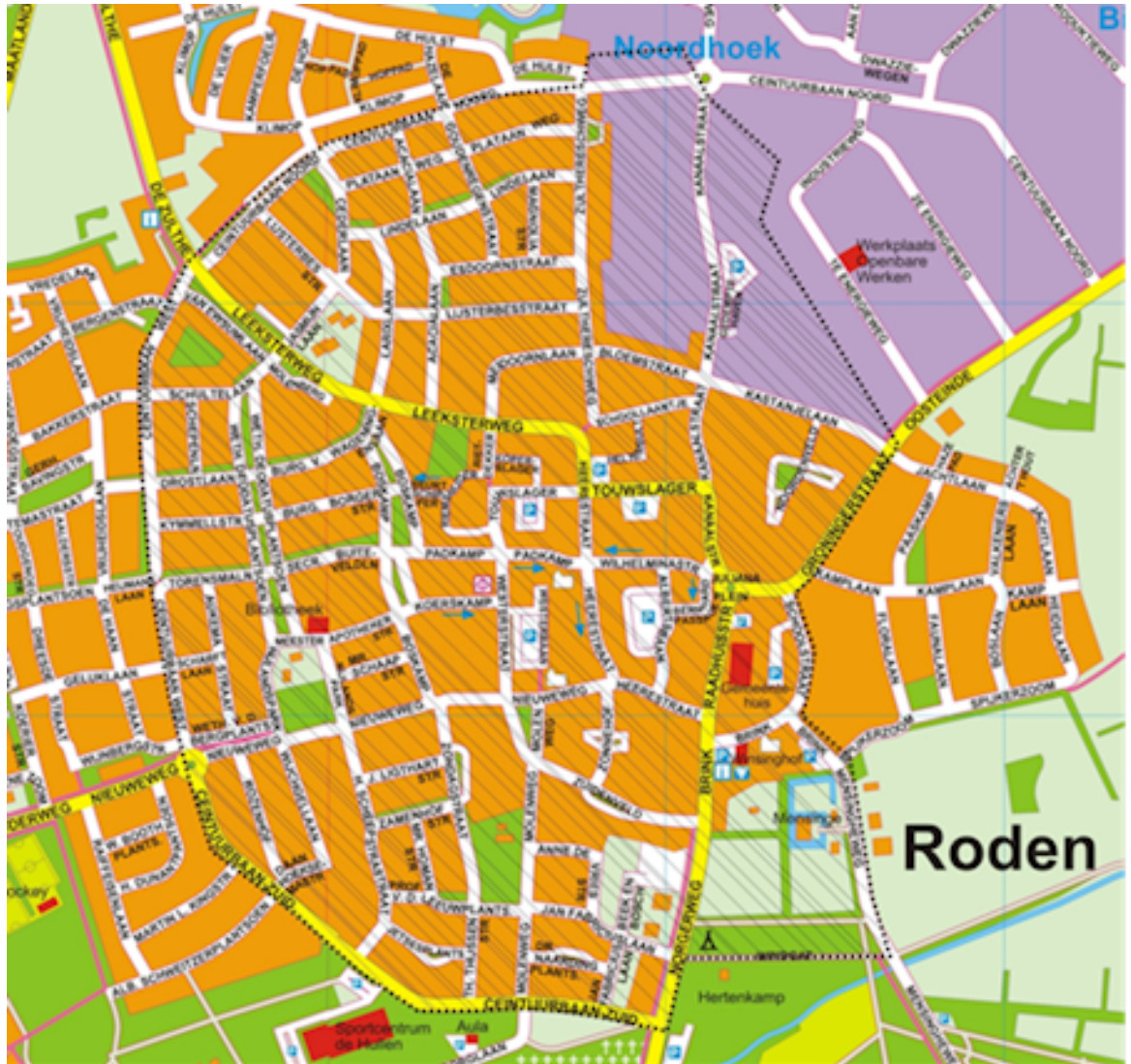
Bijlage 2: Kaart van de bedrijveninvesterings zone 'Bedrijventerreinen Roden' als bedoeld in artikel 1, onderdeel a, van deze verordening.

Het gebied Bedrijventerreinen Roden wordt omsloten door de onderstaande straten. Alle objecten gelegen aan en binnen de op de kaart aangegeven stippellijn vallen binnen de bedrijveninvesteringszone 'Bedrijventerreinen Roden':