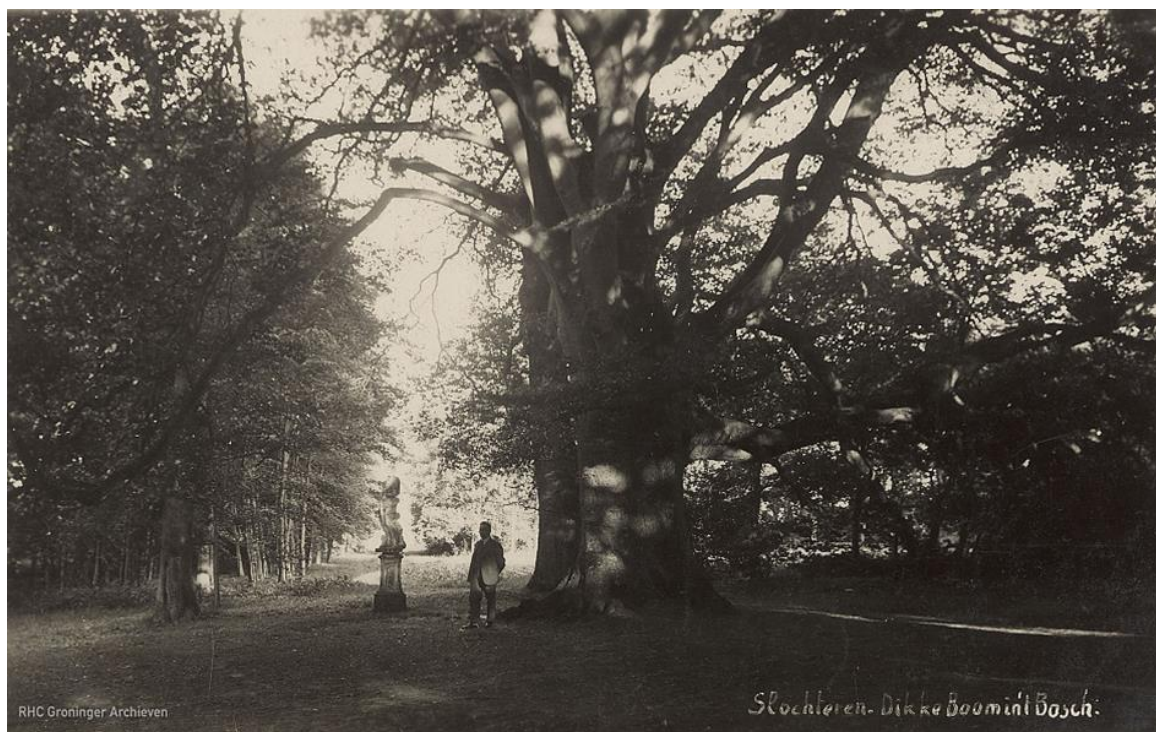
De 'Dikke Boom' in 't Slochterbos omstreeks 1925

Vanouds was het gebruik, dat het bos vrij open stond op pinkstermaandag. Het einddoel was altijd de 'Dikke Boom'. Helaas is de 'Dikke boom' geschiedenis. Een storm velde in 1963 de door zwammen aangetaste boom, maar het oude heidendom leeft er voort.