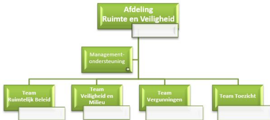
Figuur 1: Organogram RenV

In dit hoofdstuk wordt uiteengezet hoe de uitvoering van het VTH-beleidsplan geborgd wordt. De uitvoering van alle VTH-taken gebeurt binnen de afdeling Ruimte en Veiligheid (RenV) en is verdeeld over verschillende teams, zoals weergegeven in onderstaand organogram. Ambtelijke afstemming vindt wekelijks plaats. Bestuurlijk afstemming vindt plaats in portefeuillehouders overleggen.