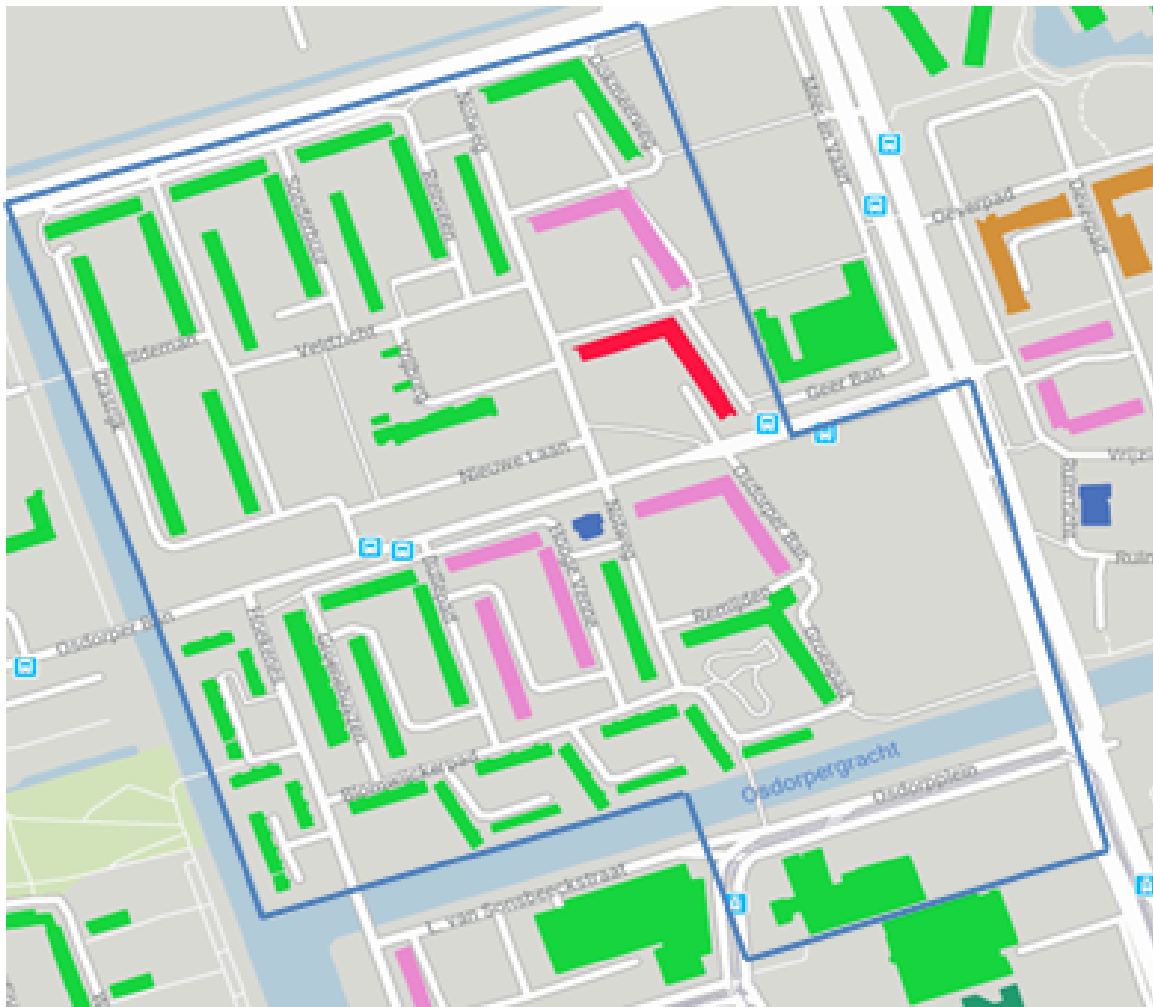
Figuur 2 – Detailkaart van het waarin het gebied 'Wildeman' blauw gemarkeerd is

De volgende postcodes worden geacht binnen het gebied te liggen.