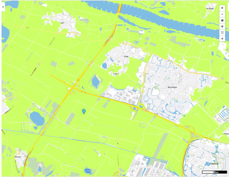
Uitsnede kaart Regels Landbouw Omgevingsverordening Gelderland, geconsolideerde versie 2018