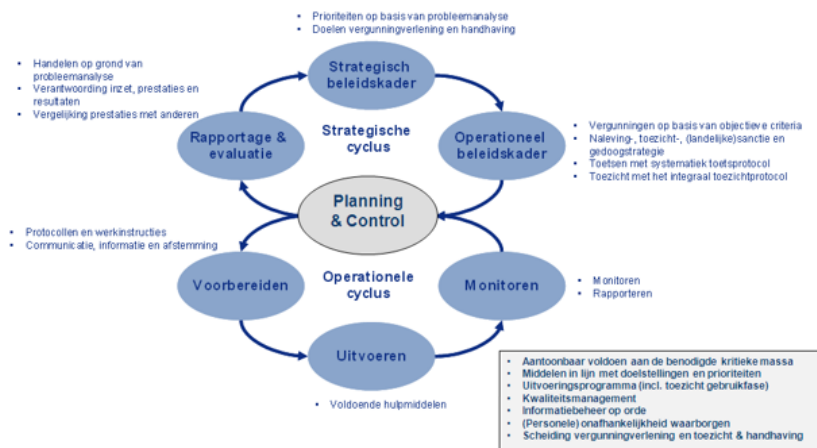
Figuur 1: BIG 8 cyclus

De reikwijdte van dit beleidsplan is de fysieke leefomgeving. Hieronder vallen de VTH-taken op het gebied van de Wabo (bouwen, milieu, ruimtelijke ordening, brandveiligheid en monumenten), de Apv (zoals evenementen en reclame-uitingen) en de Drank- en Horecawet.