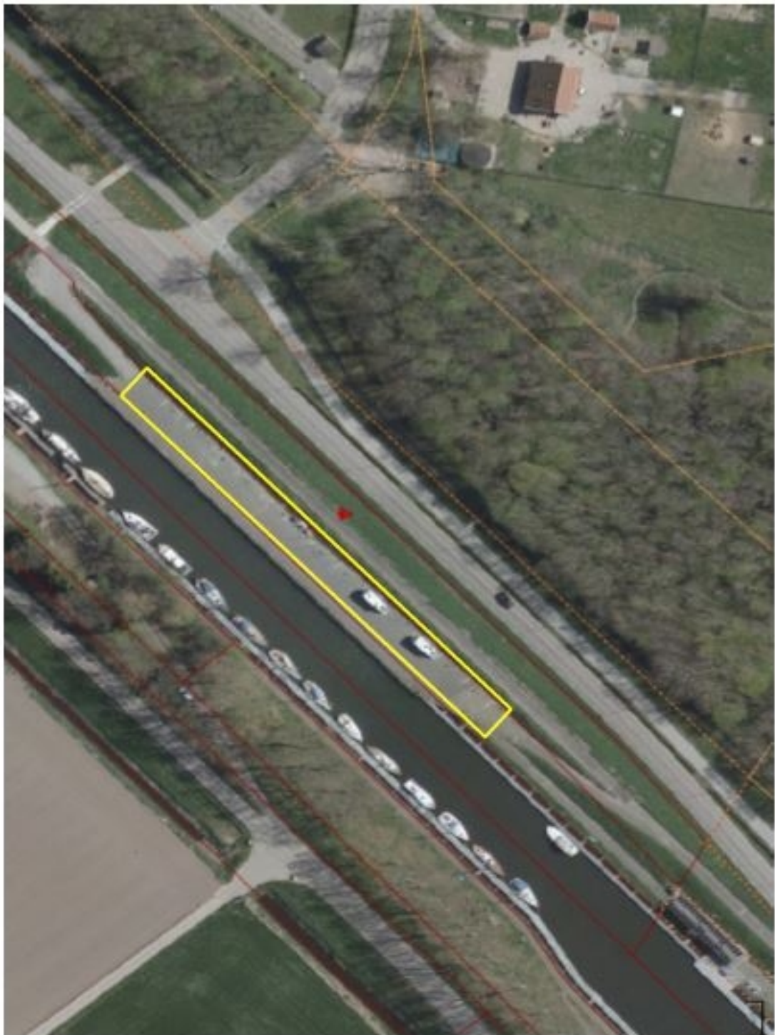
Bijlage III behorende bij verordening haven- en kadegelden Goeree-Overflakkee 2020 Gele markering van de camperplaatsen