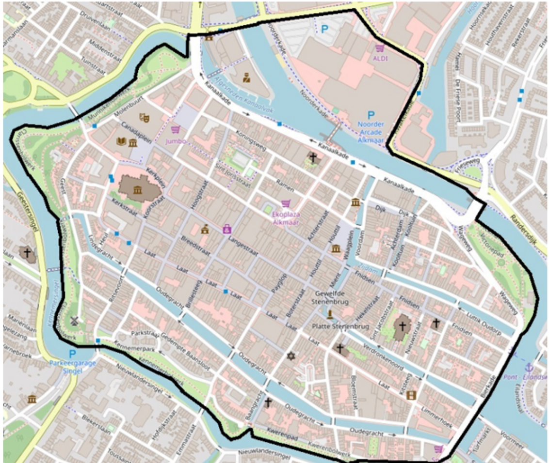
Kaart nummer 18-OOV-TS-03

Kaart behorende bij het aanwijzingsbesluit bedelverbod voor Alkmaar centrum e.o. Het bedelverbod geldt voor het aangegeven gebied binnen de kaders.