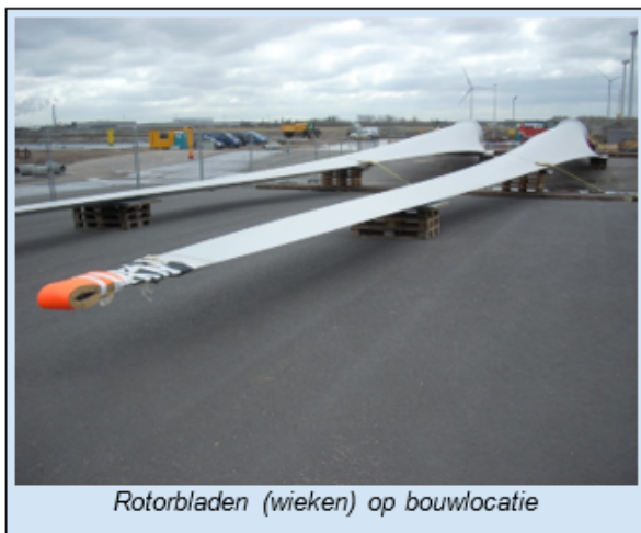
Rotorbladen (wieken) op bouwlocatie