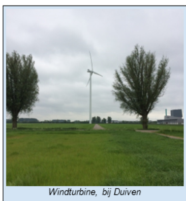
Windturbine, bij Duiven