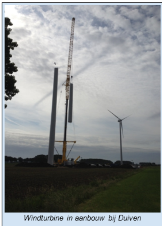
Windturbine in aanbouw bij Duiven