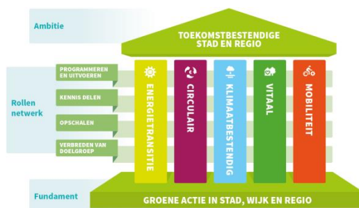
Figuur 1 ECG

De thema's energie, klimaatbestendig, circulair, mobiliteit en vitaal worden ondersteund door de Sustainable Development Goals. In alle fasen van het inkoopproces worden de effecten op people (mensen), planet (planeet/milieu) en profit/prosperity (winst/welvaart) meegenomen.